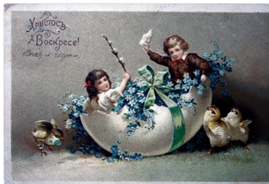
Старинная пасхальная открытка, 1910 год

В православной традиции подобной памятной датой является Воскресение Христово — древнейший христианский праздник, главное событие года для православных христиан. Он был установлен в честь воскресения Иисуса Христа. Слово «Пасха» пришло к нам из греческого языка и означает «прехождение», «избавление». В этот день христиане торжествуют избавление через Христа Спасителя всего человечества от рабства диаволу и дарование жизни и вечного блаженства. В первые века христианства Пасху праздновали не везде одновременно. На Востоке, в Малоазийских Церквях — в 14-й день Нисана (марта). А Западная Церковь совершала празднование в первый воскресный день после весеннего полнолуния. На Первом Вселенском Соборе 325 года было вынесено постановление праздновать Пасху в первое воскресенье после пасхального полнолуния, в пределах между 22 марта и 25 апреля, чтобы христианская Пасха всегда шла после иудейской. Воскресение Христово — это основа и венец христианской веры, это первая и самая великая истина, которую начали благовествовать апостолы. ☺