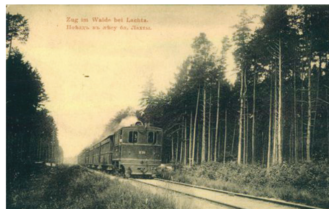
Приморская железная дорога

Сначала дачники добирались до Лахты водой – на яликах и пароходиках, отходивших от Старой Деревни. В 1894 году начала эксплуатироваться Приморская железная дорога. Время движения от станции Новая Деревня до Сестрорецка в 1894 году составляло 1 час 15 минут (для сравнения в 2020 году дорога занимает в среднем 45 минут). Первой остановкой после Новой Деревни была Лахта. Здесь был построен вокзал, где дачники любили прогуливаться. Когда ос-