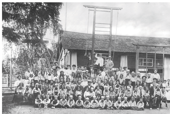
Участники детского гимнастического праздника. Лахта. 1907 год