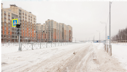
Открытие новых участков дорог. Февраль 2018 года

Также не очень обычной для современного мегаполиса является сама концепция района, в разработке которой принимали участие российские, испанские и голландские эксперты. Большую часть жилого массива составят малоэтажные и среднеэтажные дома, находящиеся в окружении природы и при этом с городской пропиской для жильцов — редкий по сегодняшним меркам формат застройки.