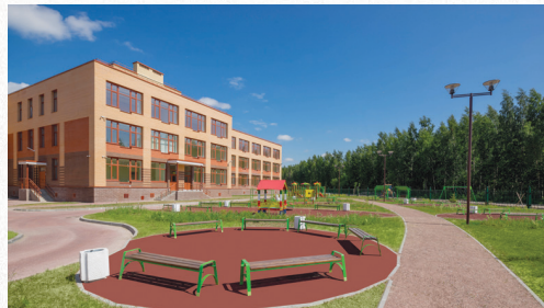
Открытие ГБОУ школы № 428 Сентябрь 2018 года

А главное, что это проект так называемого комплексного освоения территорий. То есть вместе с жильем в ЖК «Юнтолово» прокладываются дороги (построено уже два километра участков Гладышевского и Юнтоловского проспектов, Ивинской улицы), открываются магазины, аптеки, кафе.