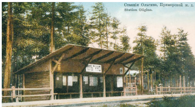
Приморская железная дорога. Станция Ольгино

Слово «дача» происходит от глагола «давать». Первоначально, это земля, данная государем своим подданным на определенных условиях: за службу в ополчении, за боевые и гражданские заслуги. Разумеется никакого отношения к загородному отдыху эта практика на первых порах не имела. Но уже в 1830-1850 годах отдых за городом становится популярен. Способствует этому строительство железных дорог, мода на путешествия и открытие новых мест, да и просто желание многих горожан поправить свое душевное и физическое здоровье. С 1905 года семья графов Стенбок-Фермор стала продавать землю вокруг Лахты под дачи. Впереди - новый век. Начинается новый период жизни Лахты и Ольгино.