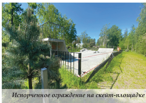
Испорченное ограждение на скейт-площадке

Вы спросите – какое отношение эта теория американских политологов имеет к современной жизни нашего муниципального образования? На самом деле связь