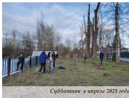
Субботник в апреле 2021 года

Может быть это покажется странным, но подростки и молодежь в большинстве своем достаточно ответственно относятся к тому месту, в котором живут. Во время проведения месячника благоустройства органы местной власти обратились к ребятам с просьбой помочь провести субботник на площадке. Они откликнулись сразу же, несмотря на выходной день и не самую теплую погоду. Отвечая на вопрос «Что заставило вас сюда прийти?», чаще всего они говорили: «Эта площадка наша, для нас, нам самим приятно проводить здесь время, когда вокруг чисто».