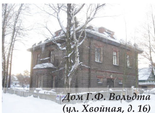
Дом Г.Ф. Вольдта (ул. Хвойная, д. 16)

В поселках Лахта и Ольгино аресты начались уже в конце 1920-ых годов. Слишком много было лиц с иностранными фамилиями, да и финны, имевшие родственников в капиталистической Финляндии, не внушали властям доверия. Одним из первых, в 1929 году, в сталинских лагерях оказался инженер Георгий Фердинандович Вольдт. В 1910-е годы он приобрел в Ольгино участок земли и по собственному проекту построил на нем дом, который сохранился по сей день. Уникальным в своем роде стало изобретение Вольдта — машина для формовки бетонных блоков. Их в то время называли бетонированными камнями. Из них Вольдт и выстроил свою дачу в Ольгино. Здание, расположенное по адресу ул. Хвойная, д. 16, сегодня является объектом культурного наследия регионального значения.