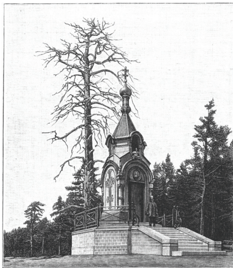
Чугунная часовня на Лахте, в память подвига Петра Великого, освященная 29-го июня. Сх. фот. грав. Рахневский.

он сильно простудился, что два месяца спустя и стало причиной его смерти.