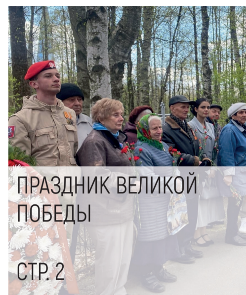
ПРАЗДНИК ВЕЛИКОЙ ПОБЕДЫ

С уважением, депутаты МС МО Лакта-Ольгино