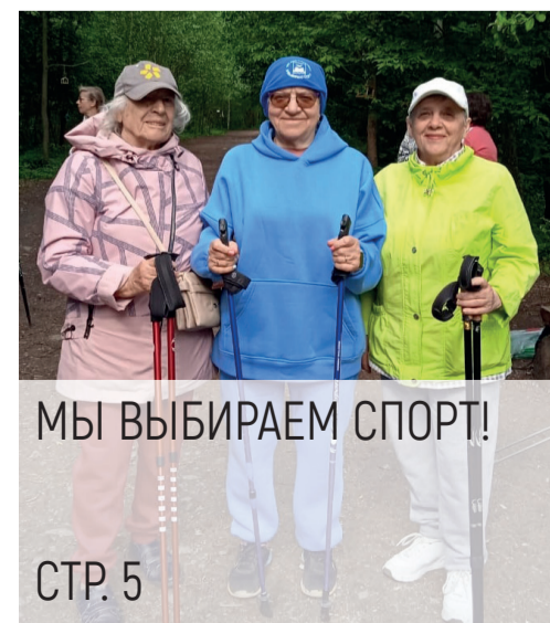
МЫ ВЫБИРАЕМ СПОРТ!