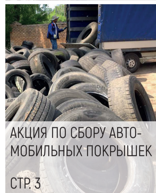
АКЦИЯ ПО СБОРУ АВТО- МОБИЛЬНЫХ ПОКРЫШЕК