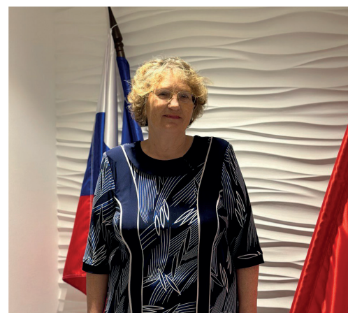
ИСТОРИЯ ЖИТЕЛЕЙ СТР. 3