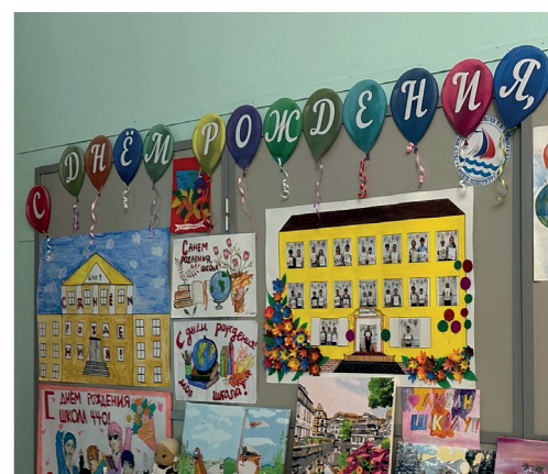
ШКОЛЕ 440 ИСПОЛНИЛОСЬ 106 ЛЕТ СТР. 4