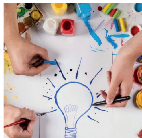
ТВОРЧЕСКИЕ КОНКУРСЫ СТР. 6