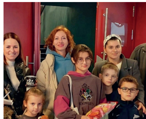
ЖИТЕЛИ ПОСЕТИЛИ ПРЕМЬЕРУ ФИЛЬМА СТР. 2

С уважением, депутаты МС МО Лахта-Ольгино