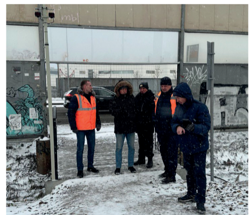
БЕЗОПАСНЫЙ ПРОХОД СТР. 3