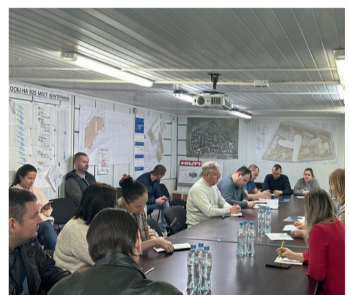
ВСТРЕЧА С ЖИТЕЛЯМИ ЖК "ЮНТОЛОВО" СТР. 4