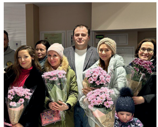
ПОЗДРАВЛЯЕМ С ДНЕМ МАТЕРИ! СТР. 2

С уважением, депутаты МС МО Лахта-Ольгино