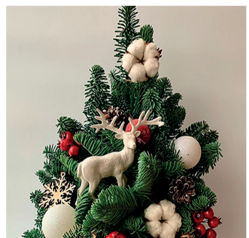
КАК ПОЛУЧИТЬ НОВОГОДНЮЮ ЕЛКУ СТР. 6